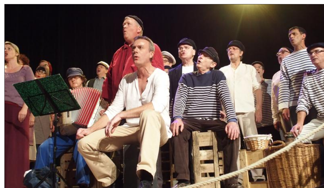
■ Faridol en concert le 16 mai, à 20 h 30, au centre socioculturel.