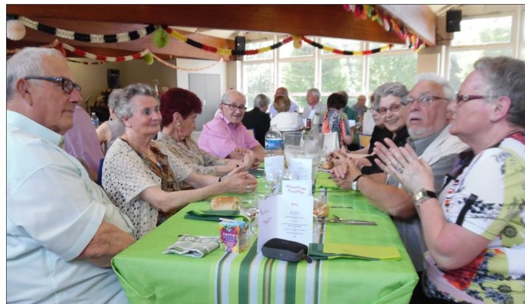
■ On évoque les souvenirs autour des tables.

Ambiance chaleureuse et amicale au repas dansant, organisé dimanche par l'Amicale des Anciens élèves des écoles de Pompey, au plateau de l'Avant-Garde. En effet, ils ont été nombreux à répondre à l'invitation et se sont retrouvés autour d'un copieux repas d'un traiteur local.