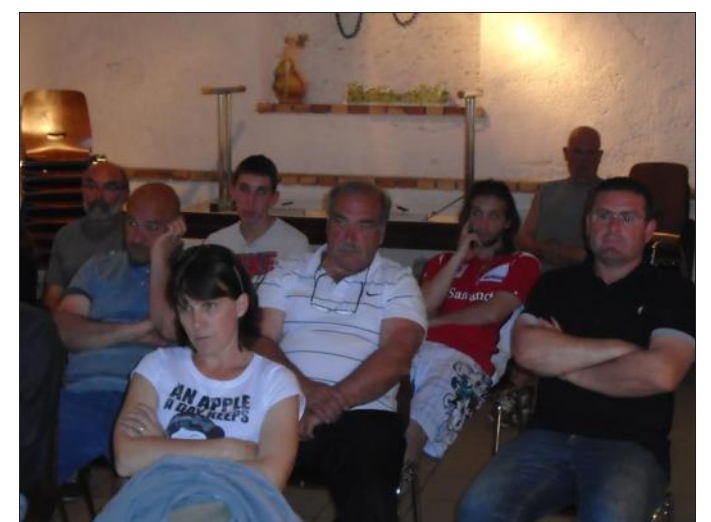
■ Un public très attentif aux remarques des responsables.

Le prochain rendez-vous se déroulera le dimanche 28 juin avec, au programme