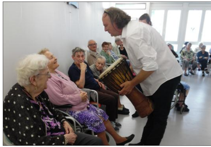
■ Les résidents jouent du djembé...

Avant de prendre un goûter « A la maison près de la fontaine », personne ne voulait que le spectacle ne s'arrête. Et « Comme un arbre » en haut des cimes du « printemps », ils ont « Fait comme l'oiseau » et chanté sans relâche pendant près d'une heure. Une belle expérience musicale pour tous car les musiciens ont permis à l'assistance, venue nombreuse pour l'occasion, de s'exprimer et de se remémorer de bons souvenirs.