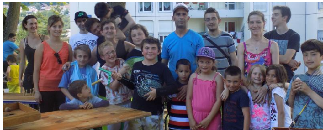
■ Une forte participation des familles, qui a ravi les organisateurs.

Dans le cadre du programme « Ça se passe en bas de chez toi », l'association Jeunes et Cités a proposé deux animations aux habitants du quartier de la Penotte. Le vendredi petits et grands étaient