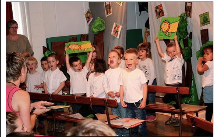
■ Les petits écoliers sur scène.

suivi, deux histoires de loup, avec « Loup loup y est-tu » et « Le loup qui voulait changer de couleur ». Les spectateurs, bien entassés dans la salle de jeux, ont applaudi chaudement les jeunes comédiens. Ensuite, place à la kermesse proprement dite, avec divers stands de jeux dans la cour de l'école. A l'heure de midi, les visiteurs se sont attablés pour déguster un repas en plein air.