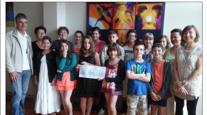
■ Les enfants, entourés des bénévoles, ont dressé un bilan de leur engagement.