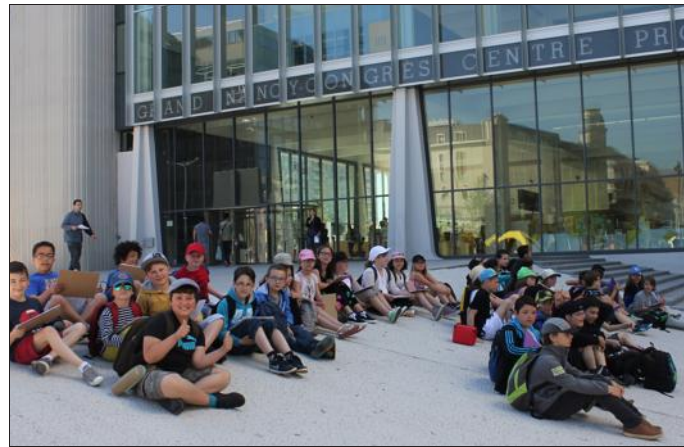
■ Les CM1 et CM2 devant le centre Prouvé de Nancy.

L'objectif étant de faire découvrir aux enfants la richesse du patrimoine local et les savoir-faire qui y sont attachés. En alternant sorties sur le terrain et travail en classe, les élèves ont pu découvrir le patrimoine avec des approches variées.